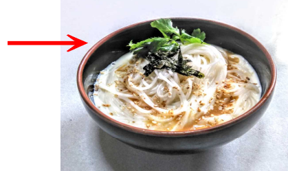
写真は調理例「ごまだれ豆乳」 そうめん。忙しい時は豆乳に麵 汁を少々でも美味しいです。